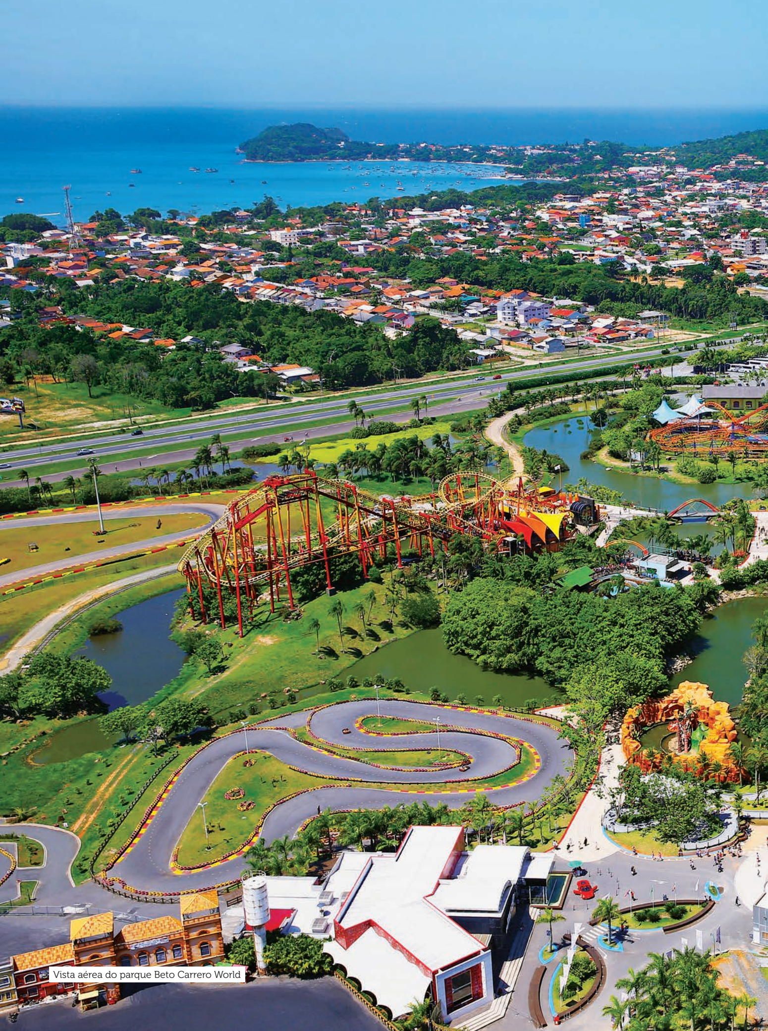
Vista aérea do parque Beto Carrero World