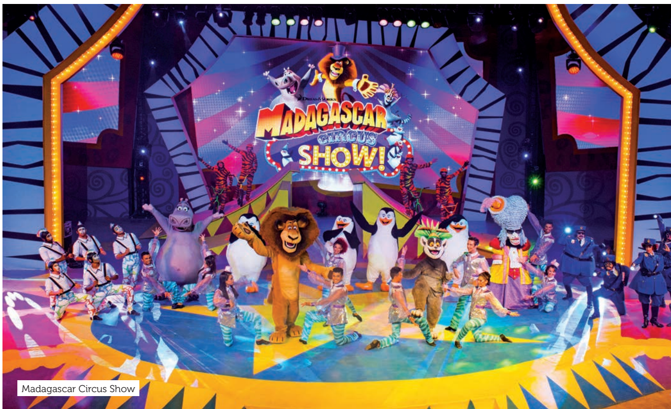
Madagascar Circus Show