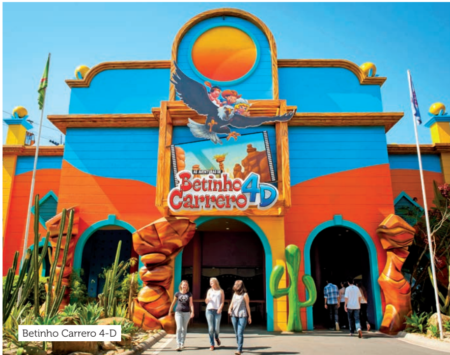
Betinho Carrero 4-D