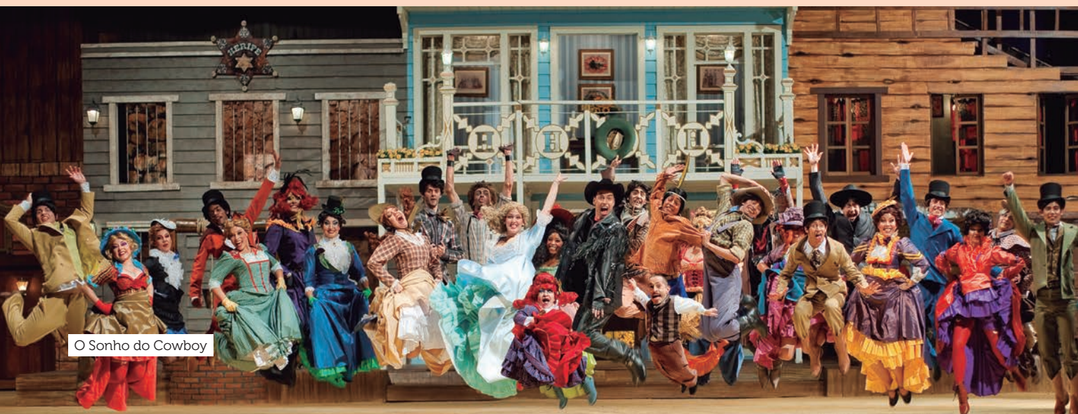
O Sonho do Cowboy

*Tempo estimado com base em voo direto, sem escalas ou conexões.