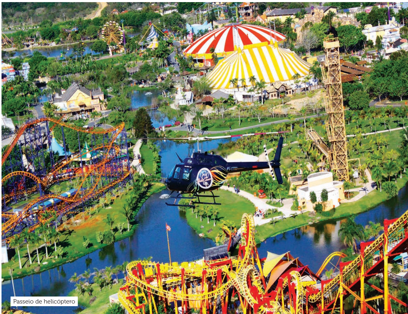
Passeio de helicóptero

O cliente pode ganhar tempo com a pulseira FastPass, que dá acesso sem filas aos brinquedos FireWhip, Big Tower, Star Mountain, Betinho Carrero 4-D, Crazy River, DinoMágic, Raskapuska e Auto-pista (bate bate). Maiores de 60 anos e menores de 1,20 metro acompanhados de um responsável com Fast Pass não precisam adquirir a pulseira.