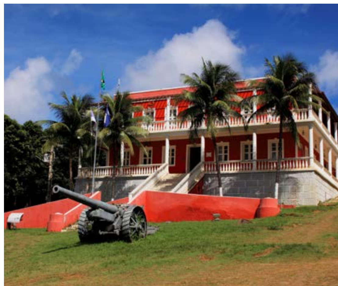
PALÁCIO SÃO MIGUEL

A vila principal é também o Centro Histórico e administrativo de Fernando de Noronha, abrigando importantes construções antigas, como o Palácio São Miguel, datado de 1948, e a Igreja de Nossa Senhora dos Remédios, erguida em 1772. Ali ficam também as ruínas do Forte dos Remédios, do século 18, onde é bacana estar no fim da tarde para admirar o lindo pôr do sol. Nas noites de sábado, vale a pena visitar a feirinha de artesanato da vila.