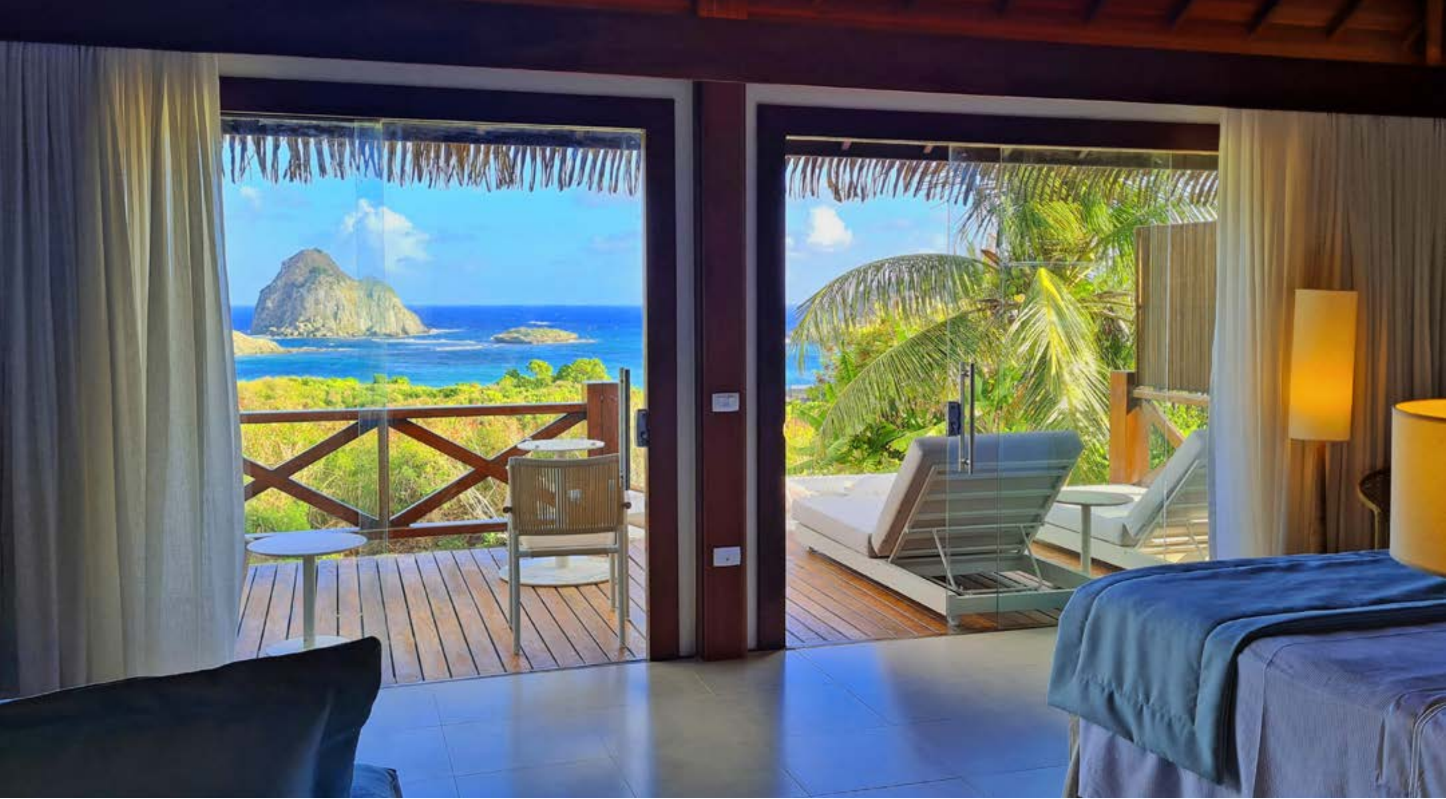
NANNAI NORONHA SOLAR DOS VENTOS

POUSADA MARIA BONITA Uma das pousadas mais conhecidas e sofisticadas de Noronha fica em Floresta Nova, a quatro quadras da Praia do Cachorro. O bom gosto está em cada detalhe da decoração, que segue a linha rústico-chique no restaurante, na área de estar, na piscina e nas lindas suítes. R. das Amendoeiras, 6, Floresta Nova.