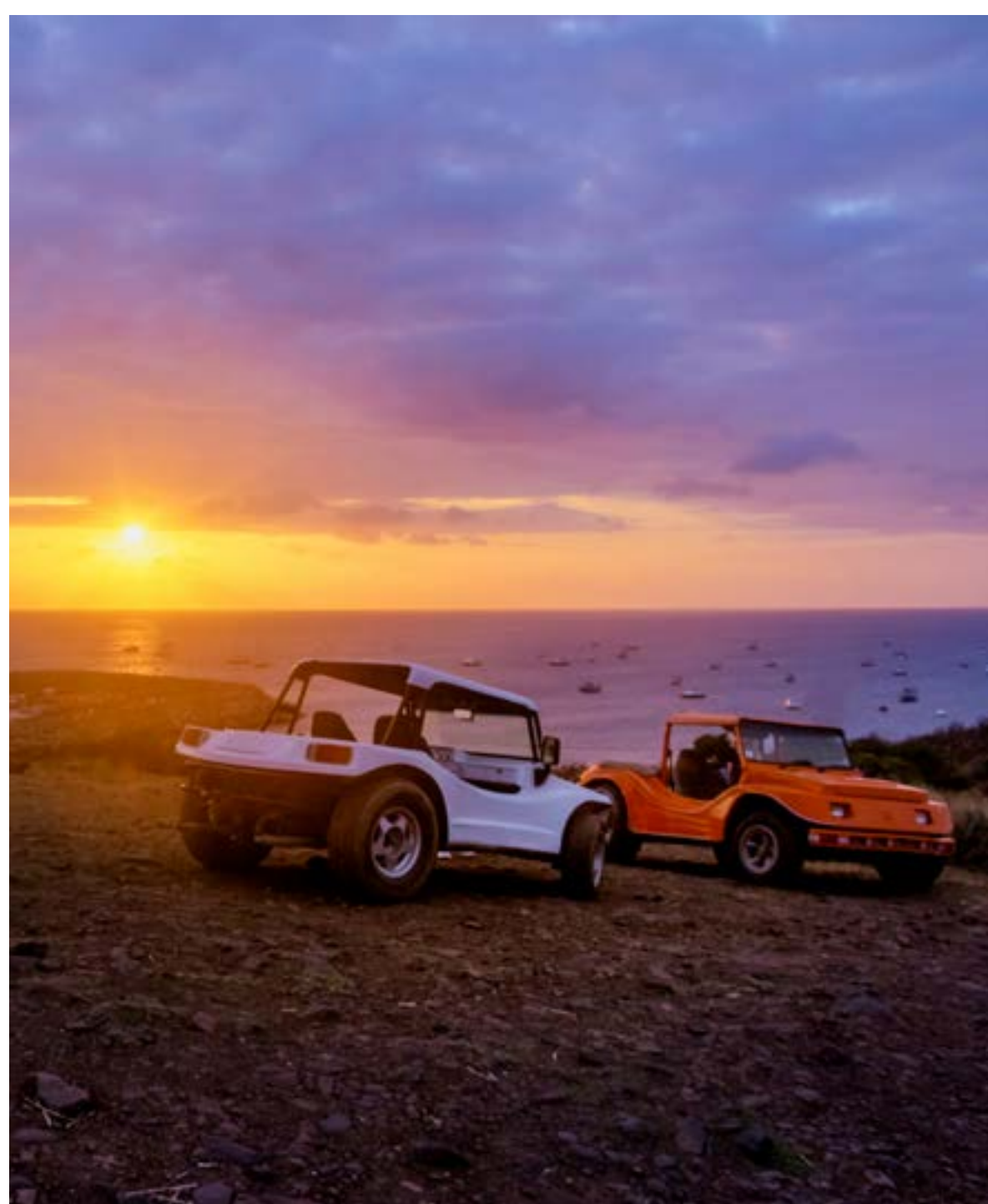
BUGUES FACILITAM A LOCOMOÇÃO EM NORONHA