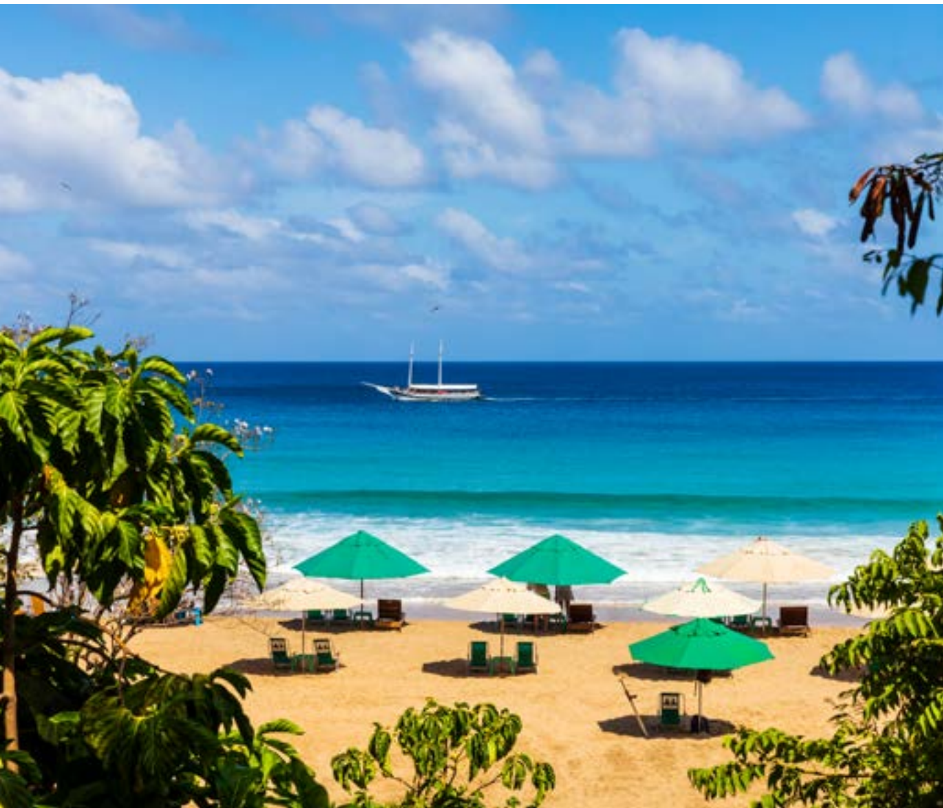
PRAIA DA CONCEIÇÃO