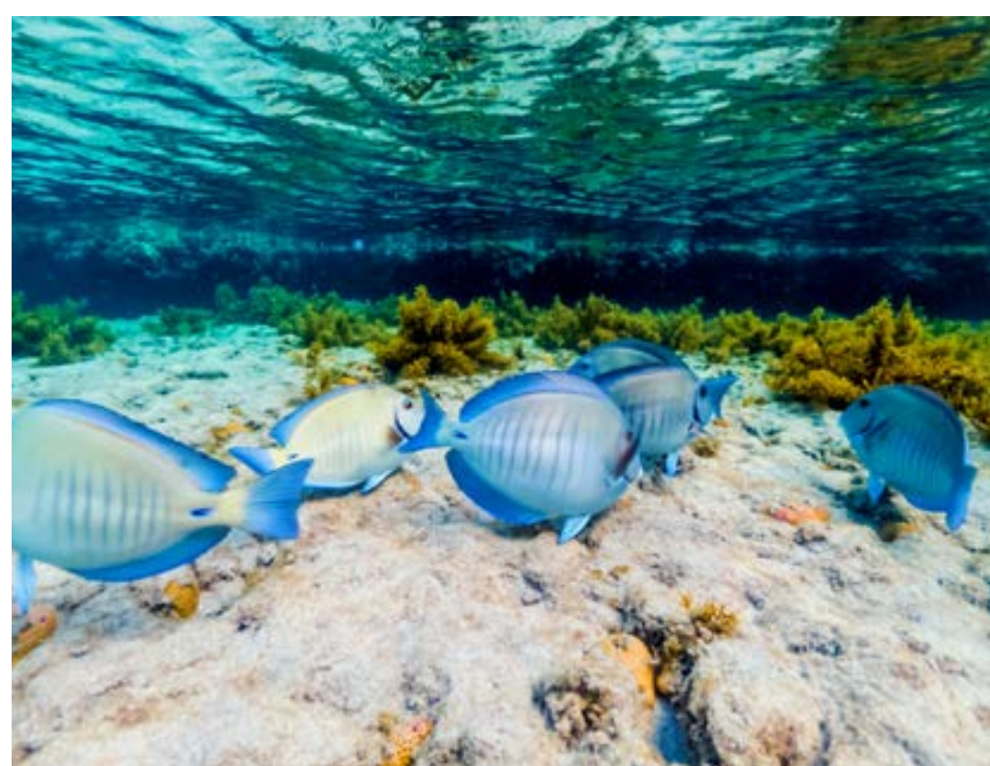
VIDA AQUÁTICA EM NORONHA

Em um veículo off road , preparado para percorrer os terrenos naturais de Fernando de Noronha, você conhece as mais lindas praias e as principais atrações do arquipélago. O roteiro passa pela Praia da Caieira, o Mirante da Praia do Bode, a Ponta do Air France e a Praia do Leão, com paradas para banho de mar na Baía dos Porcos, na Baía do Sancho, na Baía do Sueste e na Cacimba do Padre. O passeio termina ao entardecer, nas ruínas do Forte Boldró, de onde é possível admirar um deslumbrante pôr do sol colorindo o Morro Dois Irmãos. Inclui: transporte de ida e volta à pousada e guia. Duração: dia inteiro.