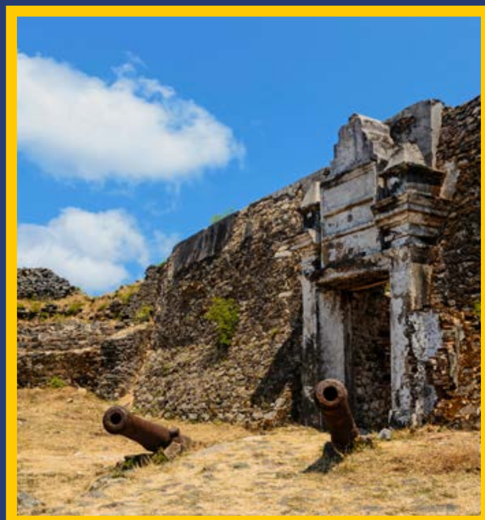
FORTE DOS REMÉDIOS