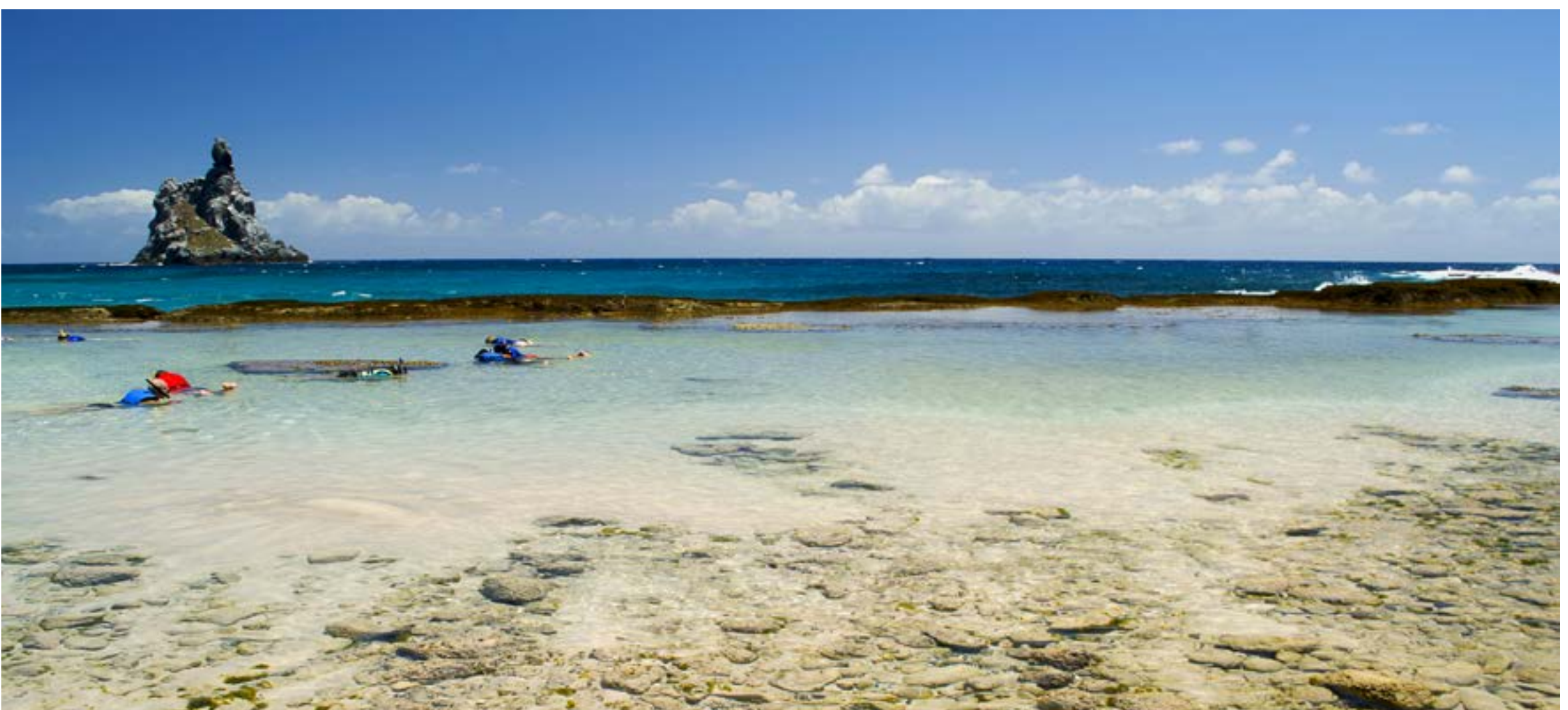
PRAIA DO ATALAIA

Esta praia do Mar de Fora tem uma linda combinação de água clara e areia vermelha. É o principal ponto de desova da tartaruga-verde, entre dezembro e maio. O nome vem da pedra em forma de leão, que fica em frente à praia, situada a 6 km da vila.