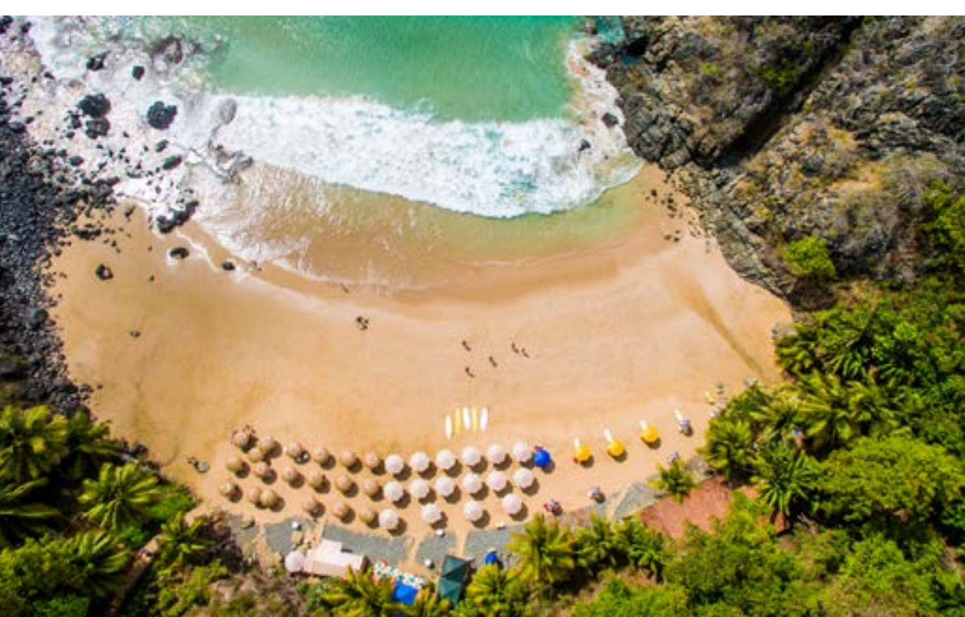
PRAIA DO CACHORRO