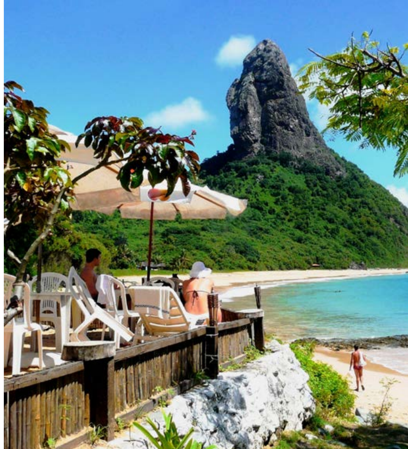
PRAIA DA CONCEIÇÃO

A praia mais movimentada de Noronha é longa, ideal para caminhar e ótimo ponto de mergulho. Além disso, é enfeitada pelo Morro do Pico, o mais alto do arquipélago. O mar é calmo de março a novembro e bom para surfe no resto do ano. Ali está também o descolado bar Duda Rei. Fica a apenas 1 km da vila.