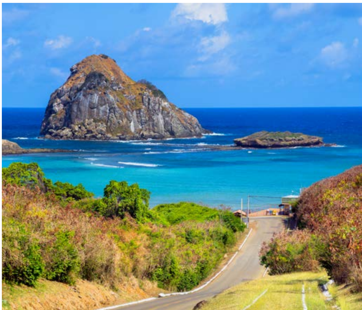
BAÍA DO SUESTE