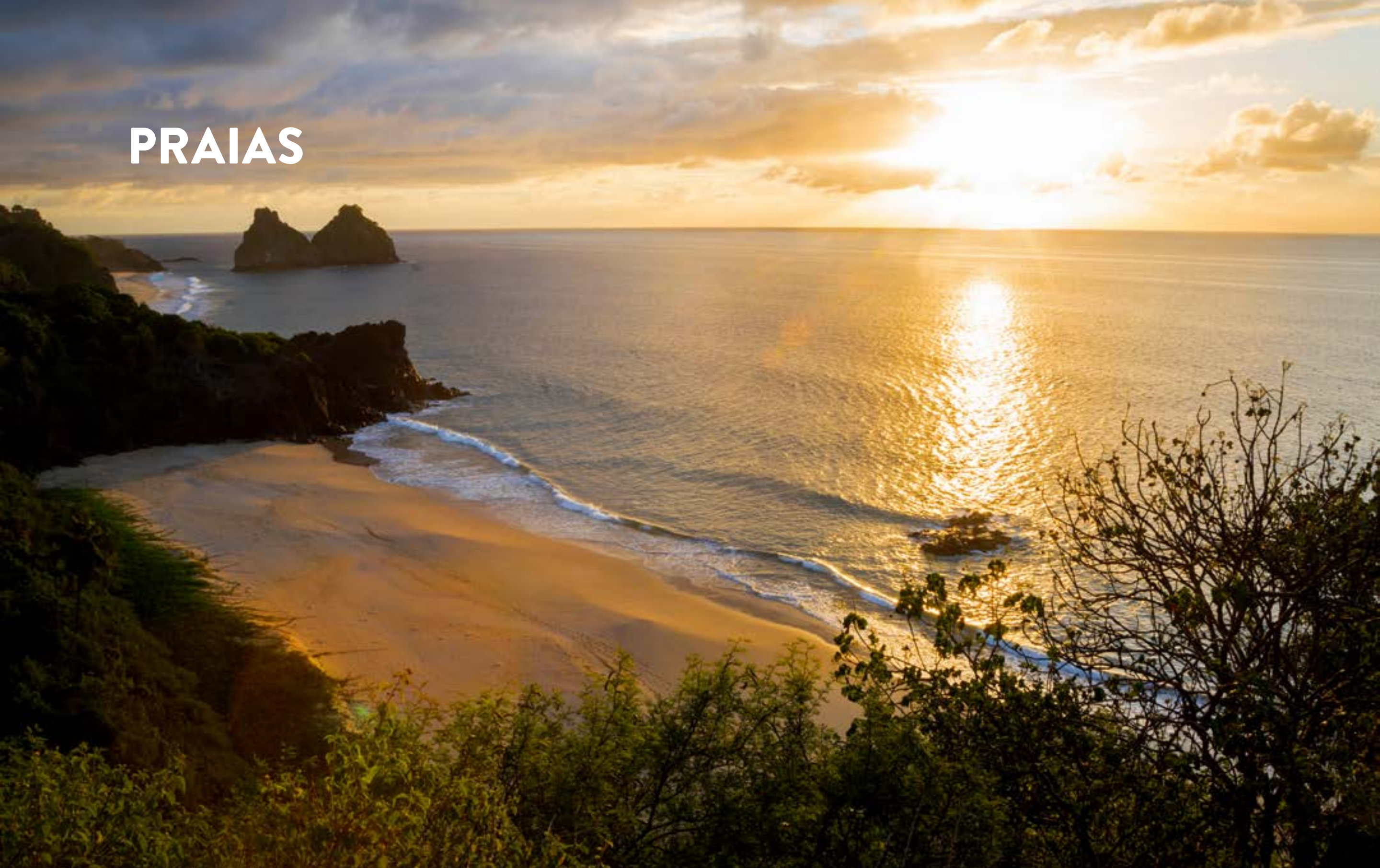
PRAIA DO BODE