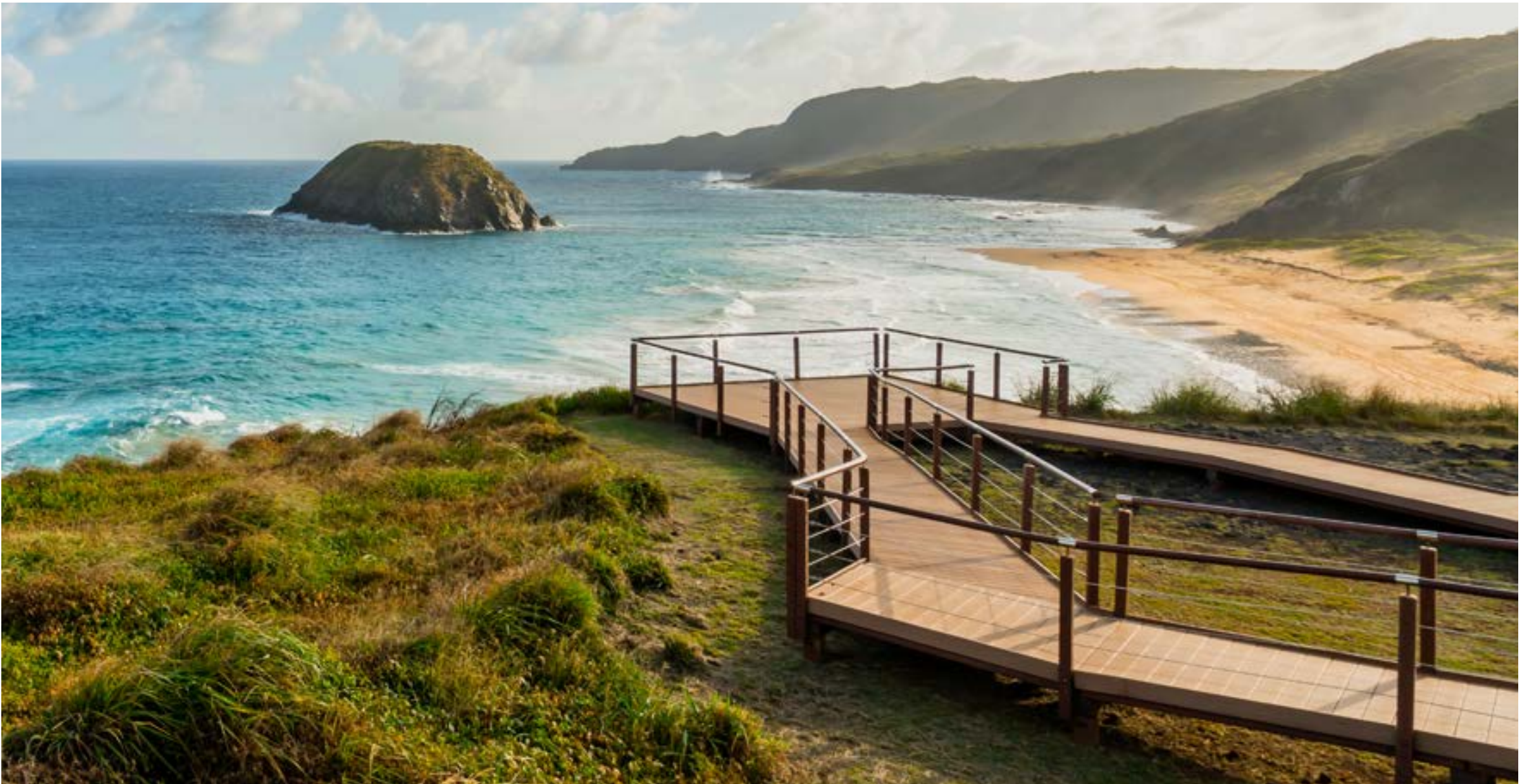
PRAIA DO LEÃO

Quase deserta, ganha duas piscinas naturais na maré baixa, com acesso feito por uma descida íngreme entre as rochas. Para visitar a praia, localizada a 6 km da vila, é preciso agendar no centro de visitantes do parque.