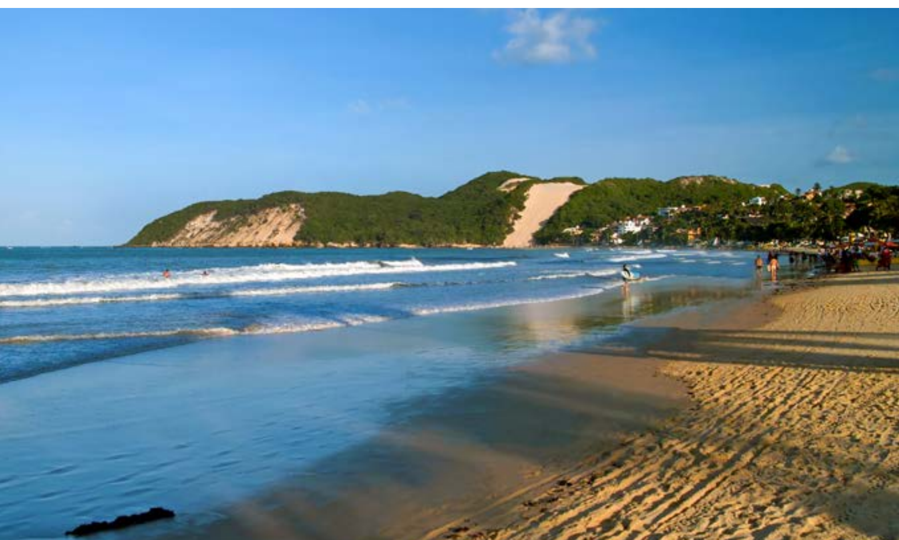
PRAIA DE PONTA NEGRA, EM NATAL