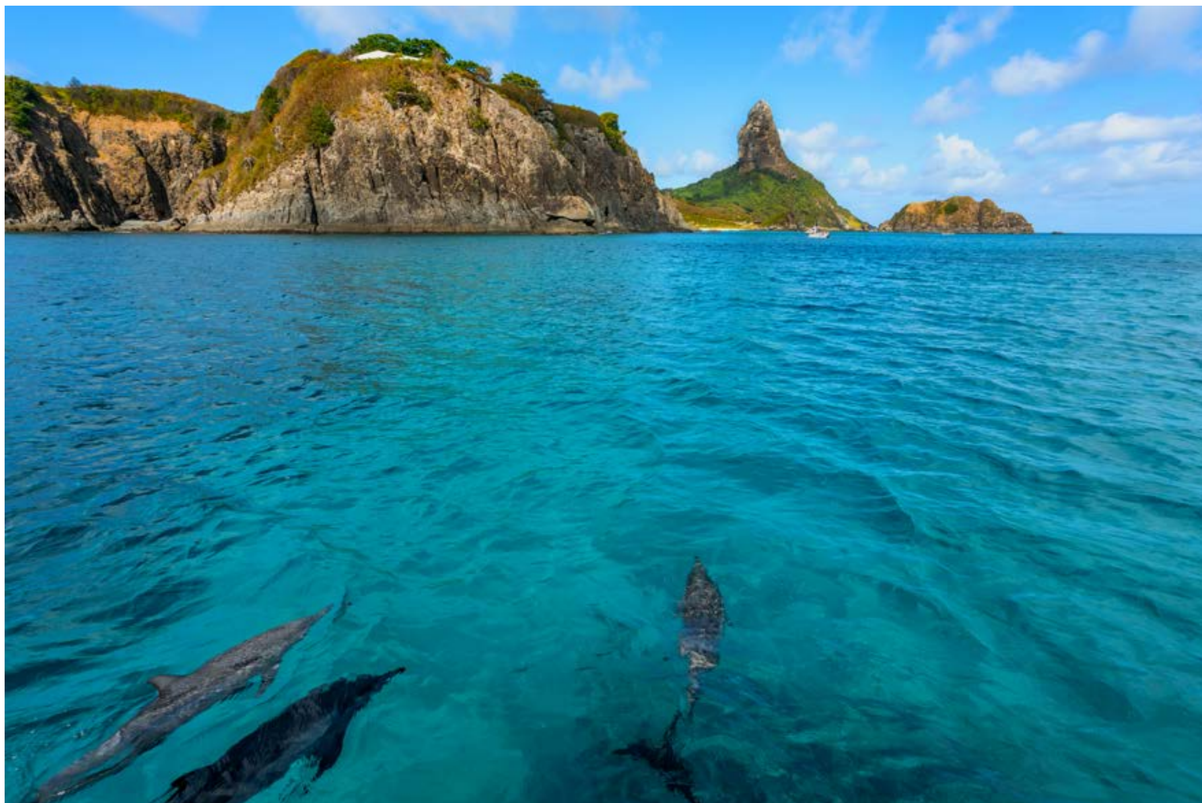
GOLFINHOS AVISTADOS DURANTE PASSEIO DE BARCO

É emocionante ver os golfinhos, que, na maioria das vezes, aparecem se exibindo em alto-mar durante este passeio de barco. A bordo de uma traineira ou um catamarã, você navega ao longo de uma costa inteira da ilha, de ponta a ponta, passando em frente às principais praias, como as do Cachorro, da Conceição e do Boldró, além das baías dos Porcos, dos Golfinhos e do Sancho, onde há parada para um gostoso banho de mar. Inclui: transporte de ida e volta à pousada e guia. Duração: 3 horas.