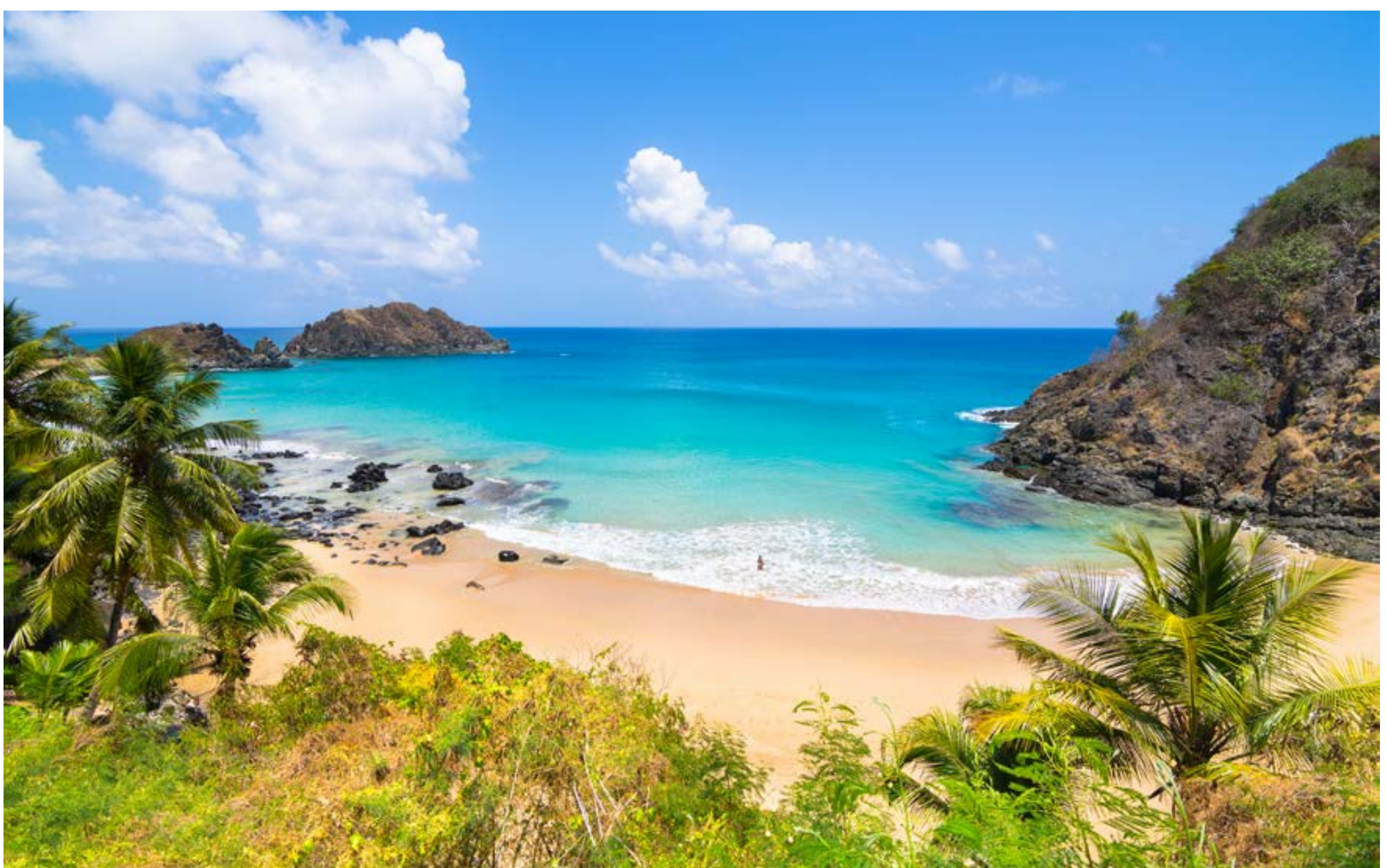
PRAIA DO CACHORRO

É muito fácil chegar a esta pequena praia de águas claras, localizada na própria Vila dos Remédios e muito frequentada pelos noronhenses. Entre abril e outubro, quando o mar está mais tranquilo, há estrutura de barracas na areia.