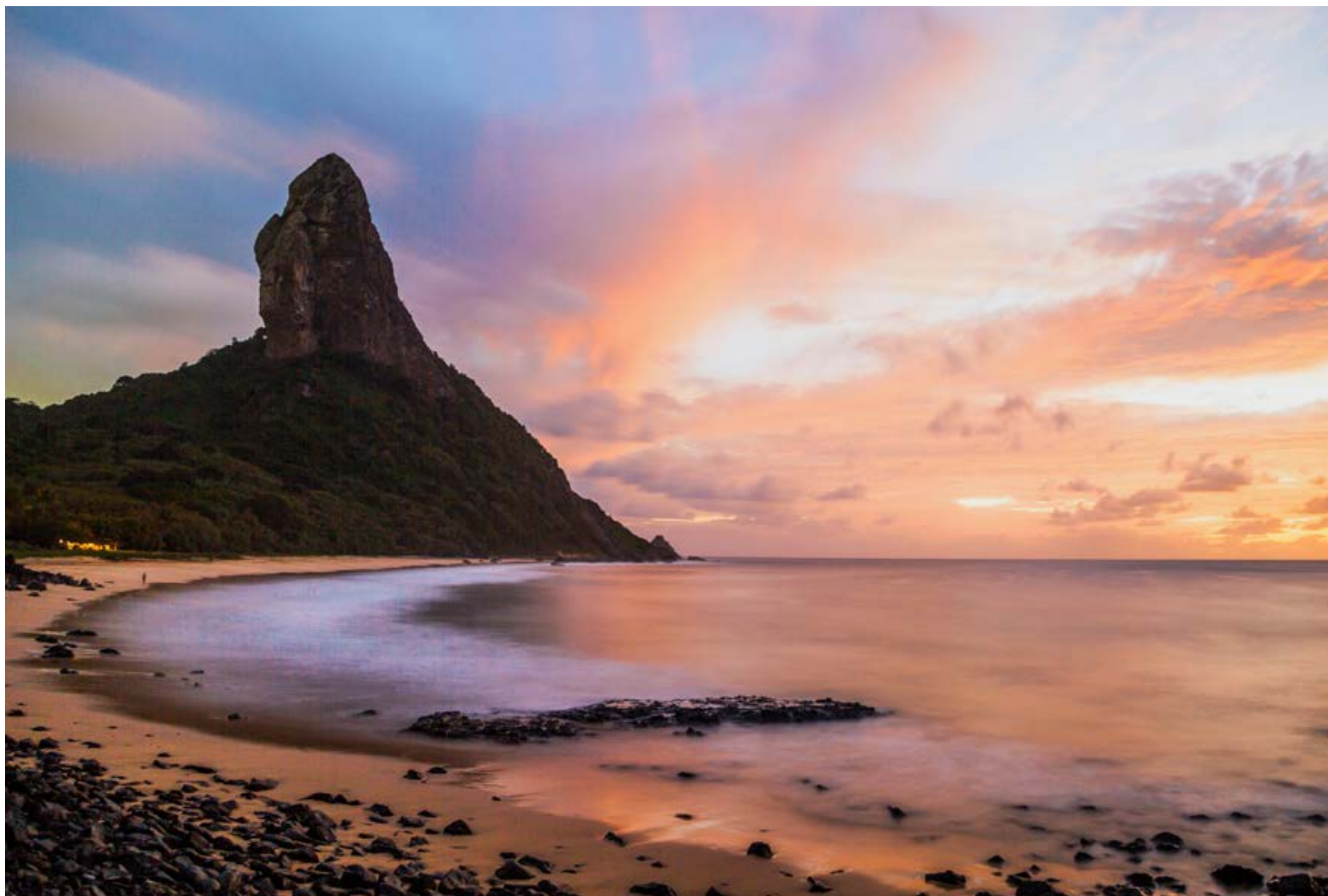
MORRO DO PICO

Ao lado da Praia da Conceição, o ponto mais alto de Fernando de Noronha atinge 323 m, coroando as montanhas de origem vulcânica que formam o arquipélago. Diz a lenda que um casal de gigantes teria contrariado as regras ao se apaixonar e, como punição, foi petrificado: ele se transformou no Morro do Pico, que tem formato fálico; e ela, no Morro Dois Irmãos, com forma de seios.