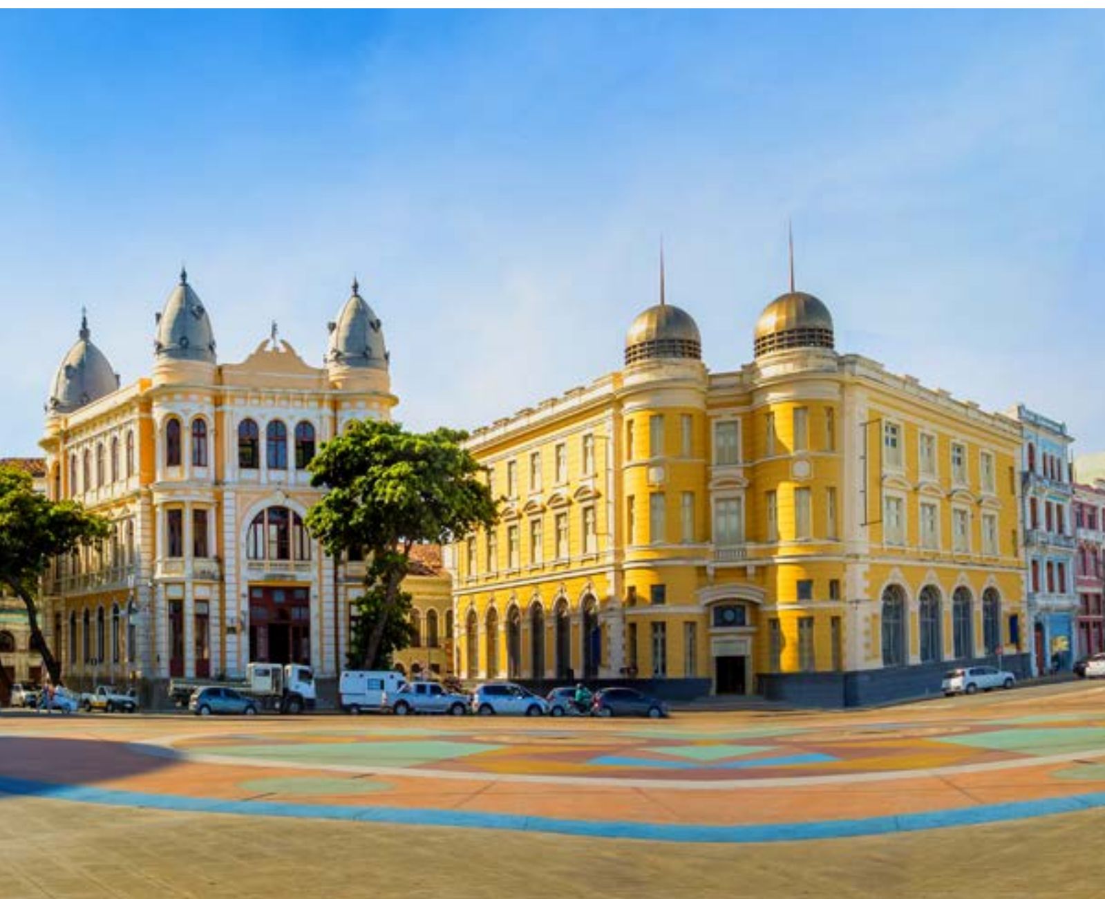
MARCO ZERO, EM RECIFE