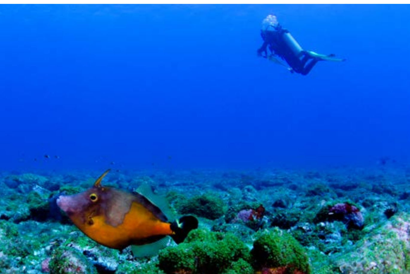
MERGULHO EM NORONHA

Você entende por que Noronha é considerado um dos melhores pontos de mergulho do mundo ao explorar suas águas mornas, com visibilidade de 50 m e rica vida marinha. Para fazer esse tipo de mergulho, que desce a uma profundidade de 12 m, não é preciso ter o curso de certificação. Um instrutor passa todas as orientações necessárias e acompanha a atividade o tempo inteiro. Inclui: transporte de ida e volta à pousada, instrutor, equipamentos de mergulho e saída de barco. Duração: 3 horas.