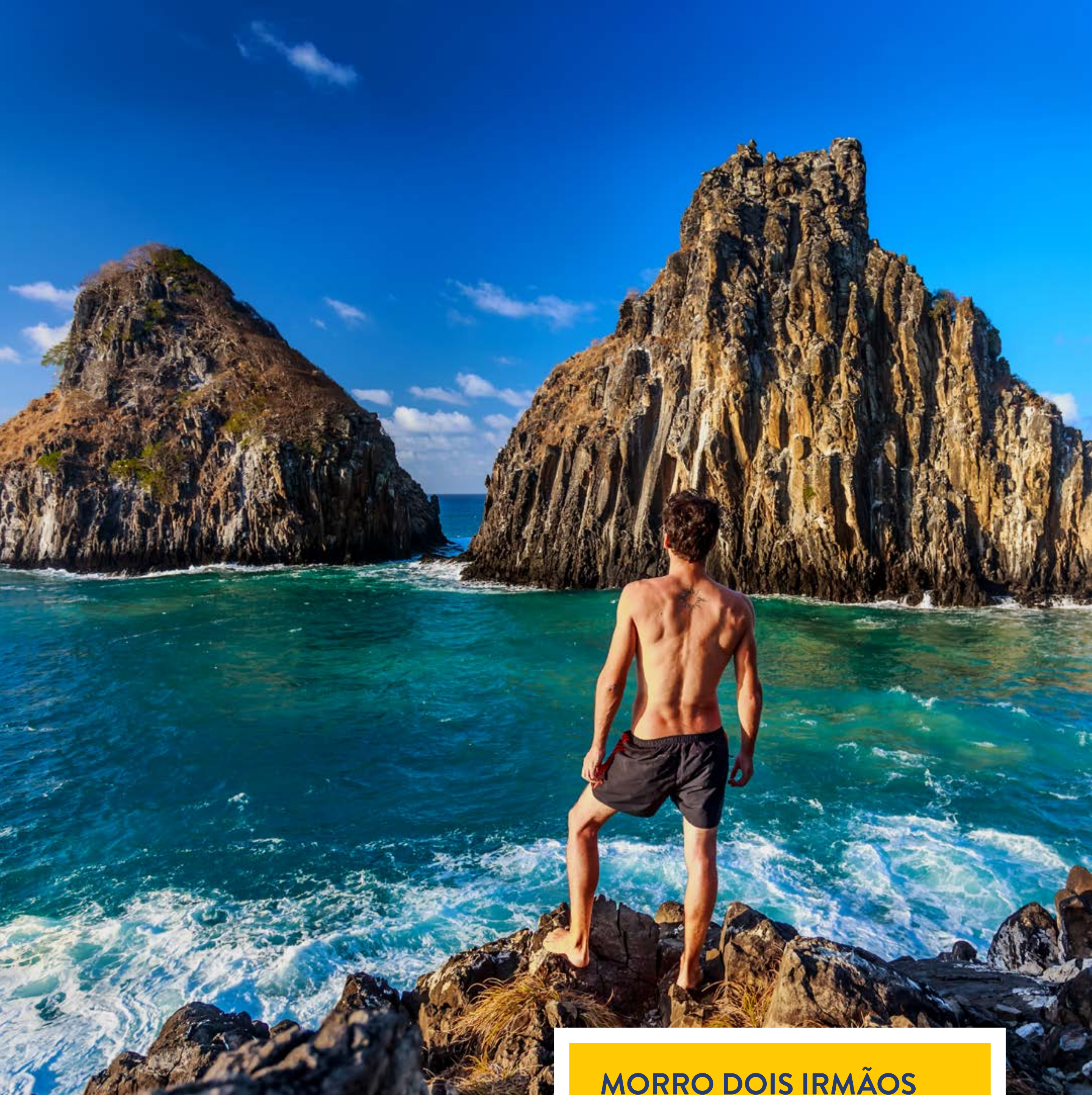
MORRO DOIS IRMÃOS