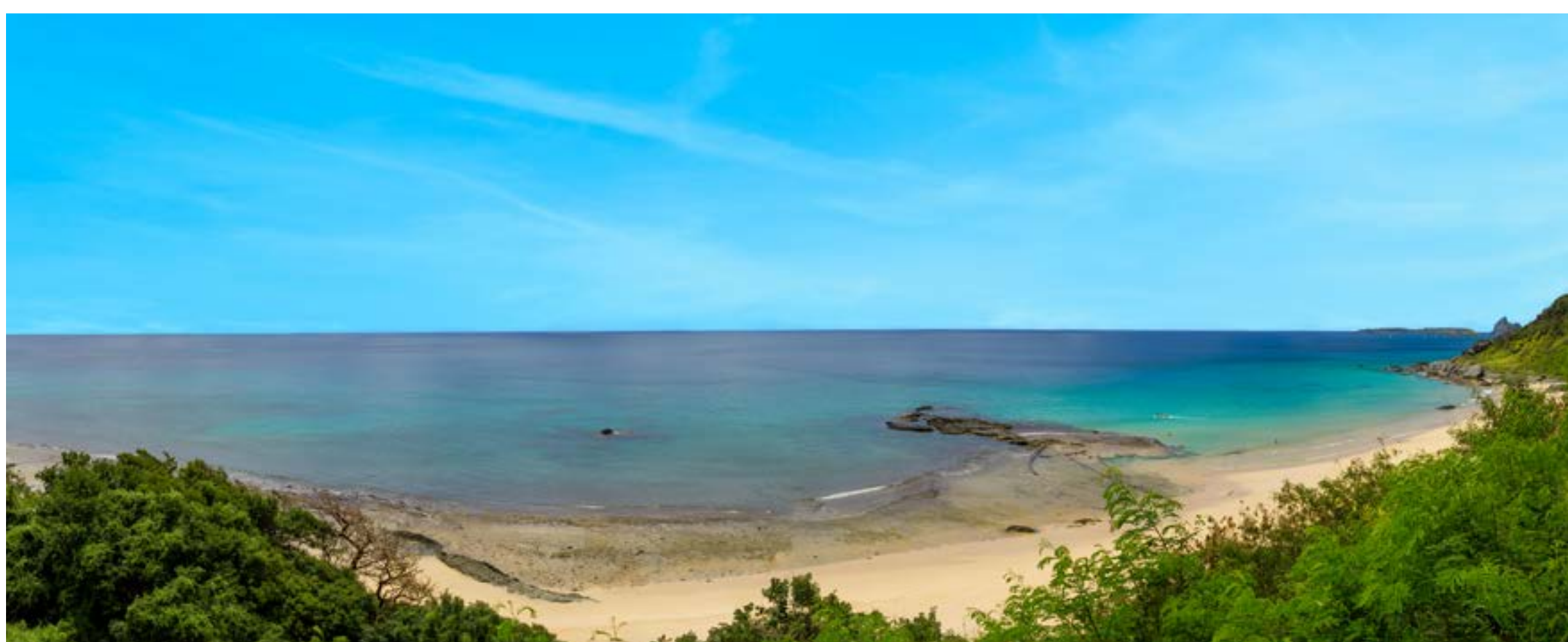
PRAIA DO BOLDRÓ