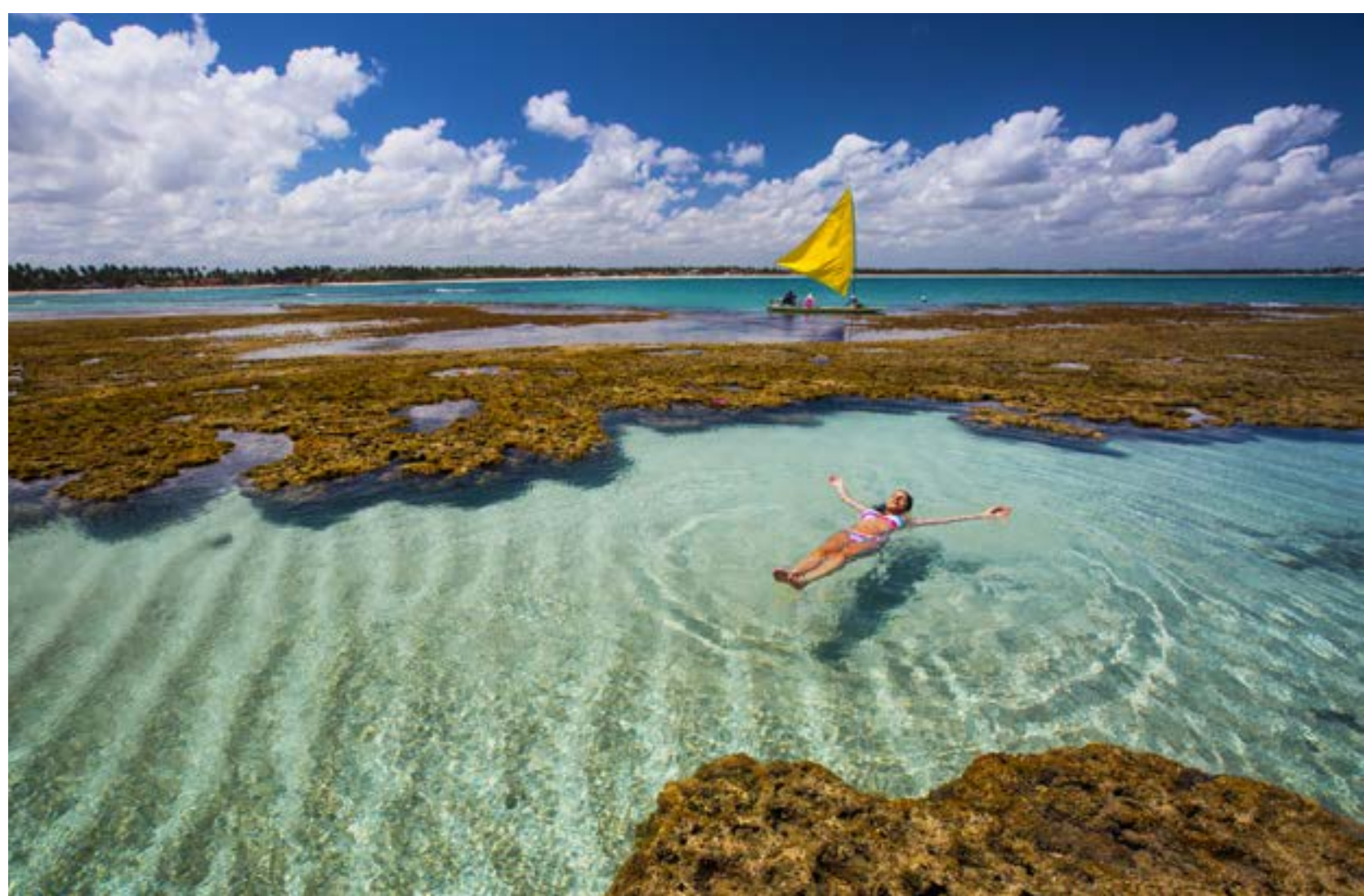
PISCINAIS NATURAIS DE PORTO DE GALINHAS

A praia, em Pernambuco, é palco para o famoso passeio de jangada até as piscinas naturais, repletas de peixinhos. O mar clarinho, represado por corais e rico em biodiversidade, tem a agradável temperatura de 28 °C. A vila de Porto de Galinhas concentra também lojas, hotéis e restaurantes, um belo cenário para bater perna. Fica a 60 km de Recife.