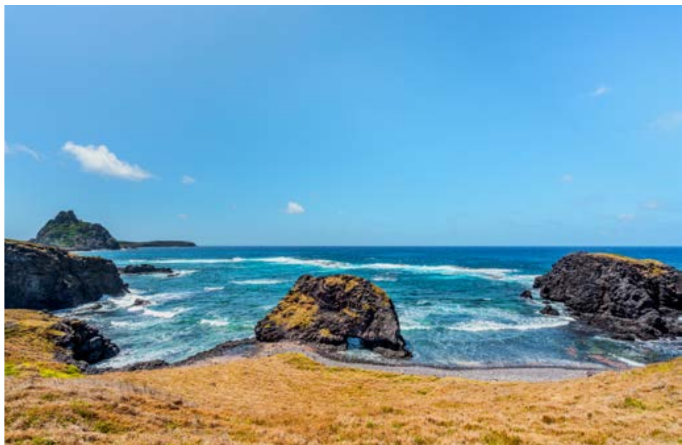
BURACO DA RAQUEL