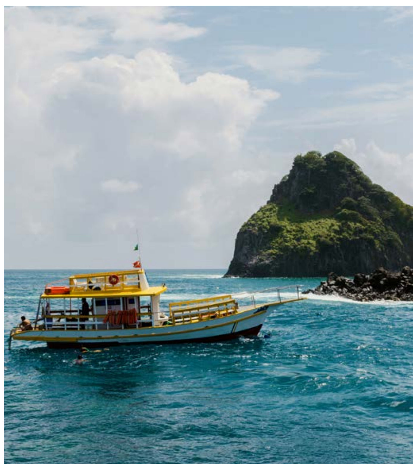
PASSEIO DE BARCO