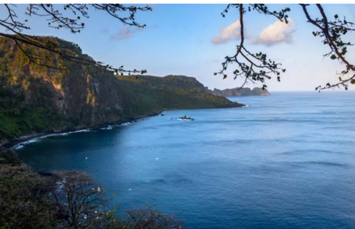
BAÍA DOS GOLFINHOS

As praias de Noronha são banhadas pelo Mar de Dentro, voltados para o continente, ou o Mar de Fora, voltados para o oceano. Em algumas, de acesso proibido, você admira a vista a partir dos mirantes.