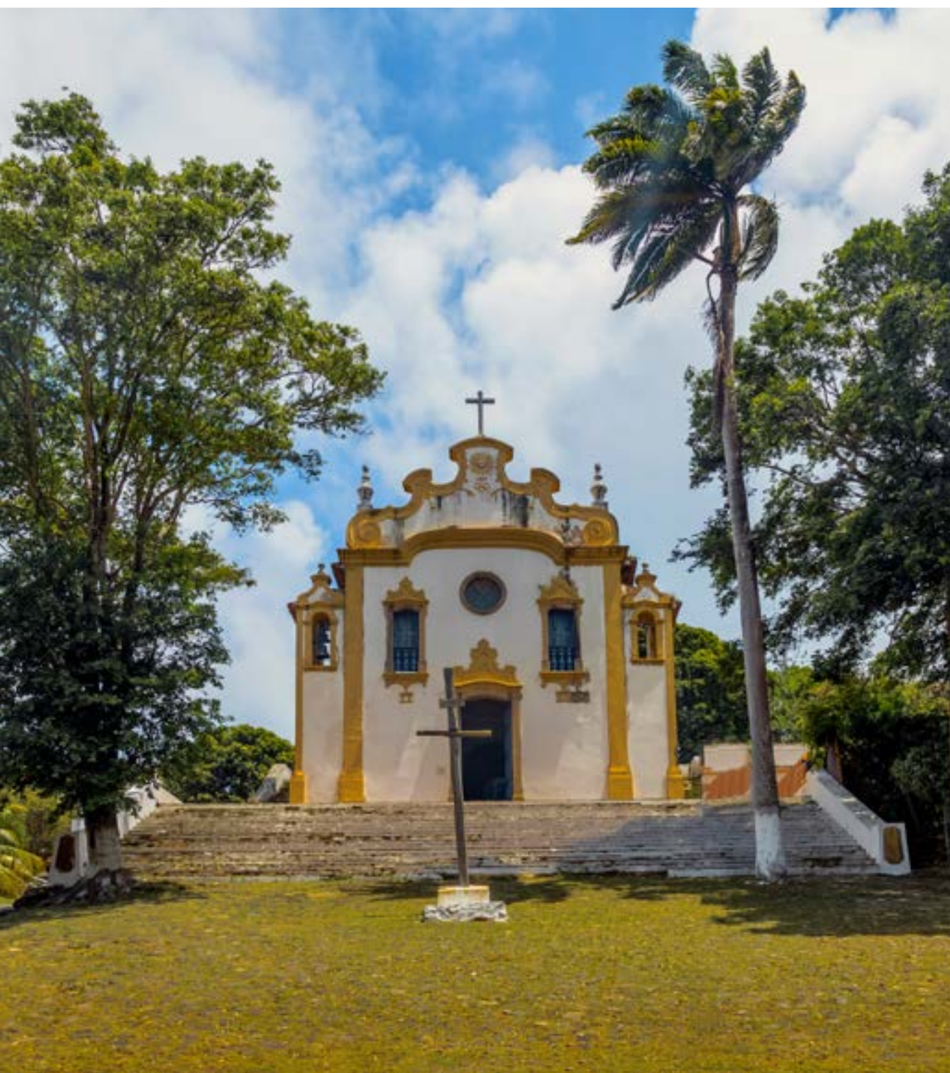
IGREJA NOSSA SENHORA DOS REMÉDIOS

Compre mais de um dos passeios incríveis, vistos nas páginas anteriores, para ter descontos e para aproveitar mais a viagem. Os passeios de cada combo são feitos em dias diferentes.